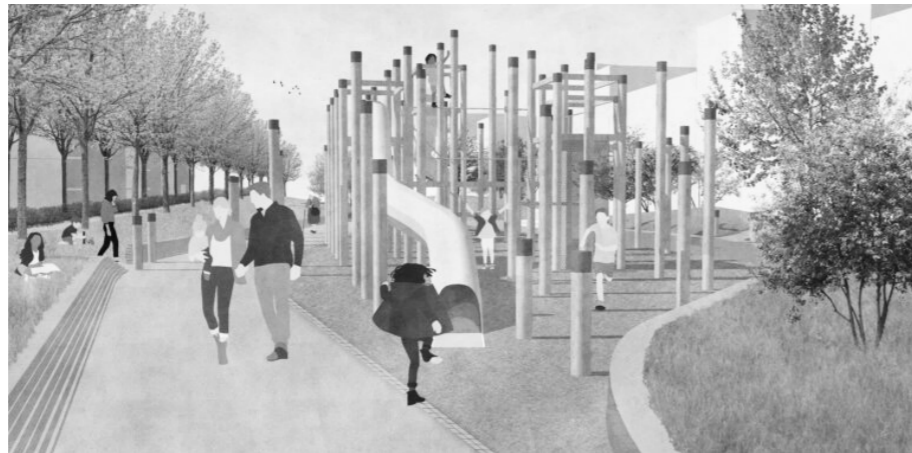
het houten palenbos met glijbanen en boomhutten.