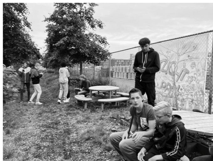
Bezoek locatie picknicktafels