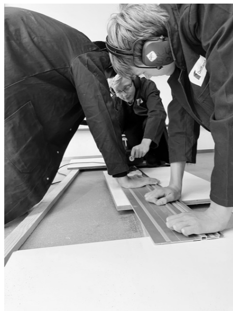
Start met het zagen van de onderdelen

Als de productie geheel volgens de planning verloopt, dan worden de boekenkasten rond de herfstvakantie geplaatst en is de wijk en het park weer een ontmoetingsplek rijker geworden (FP).