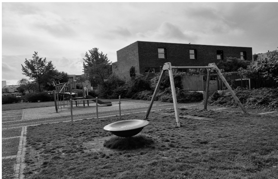
De speeltuin in afwachting van de nieuwe schommel

Uiteraard, geheel conform de eisen van goed bestuur, volgde eerst een inspraakronde. De buurt kon uit 2 opzetten kiezen. De uitslag van de enquête volgde ergens in dit voorjaar. De uitvoering werd voortvarend ter hand werd genomen. In de zomervakantie konden naar lieve lust de nieuwe speeltoestellen ingewijd worden. Na de regen kwam immers de zonneschijn. Er werd geklommen in de touwen, gegymd aan het klimrek, gegleden van de glijbaan, gedraaid in de groene schotel én geschommeld. Het werd weer een gezellige speel- en ontmoetingsplek.